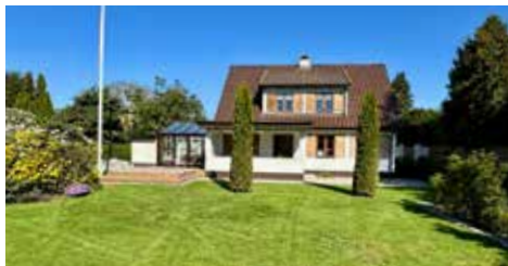
VED FORTUNEN 13