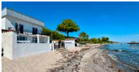
SKODSBORG STRANDVEJ 68