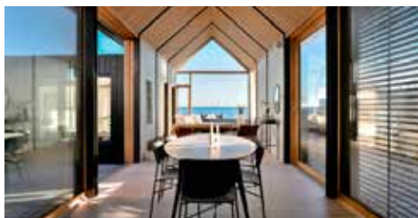
TAARBÆK STRANDVEJ 44C