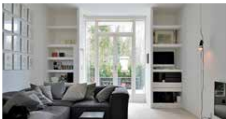
TAARBÆK STRANDVEJ 65A, ST. TV.