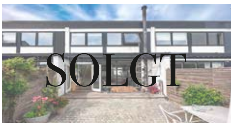
TAARBÆK STRANDVEJ 105G