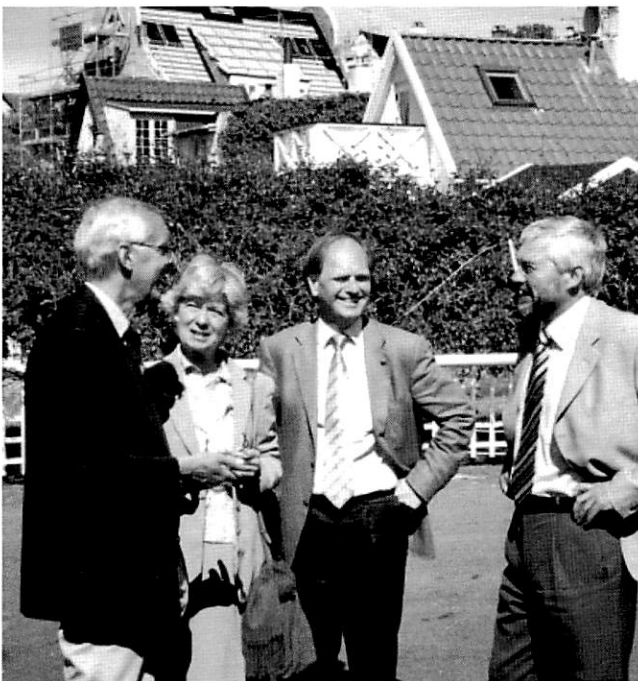
Fra indvielsen af barkekedlen i Taarbæk havn. I midten Leise Mærsk Mc-Kinney Møller og borgmester Rolf Aagaard-Svendsen.

Husk at aftale optagning med havnefogden god tid i forvejen. Efter 1. november tages der kun både på land på hverdage. Betaling for kran sker samtidig med optagningen.