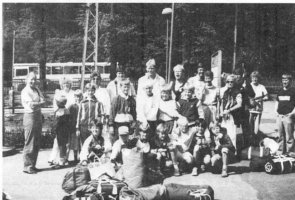
LILLEPUTHOLDETS START MOD NR. ALSLEV