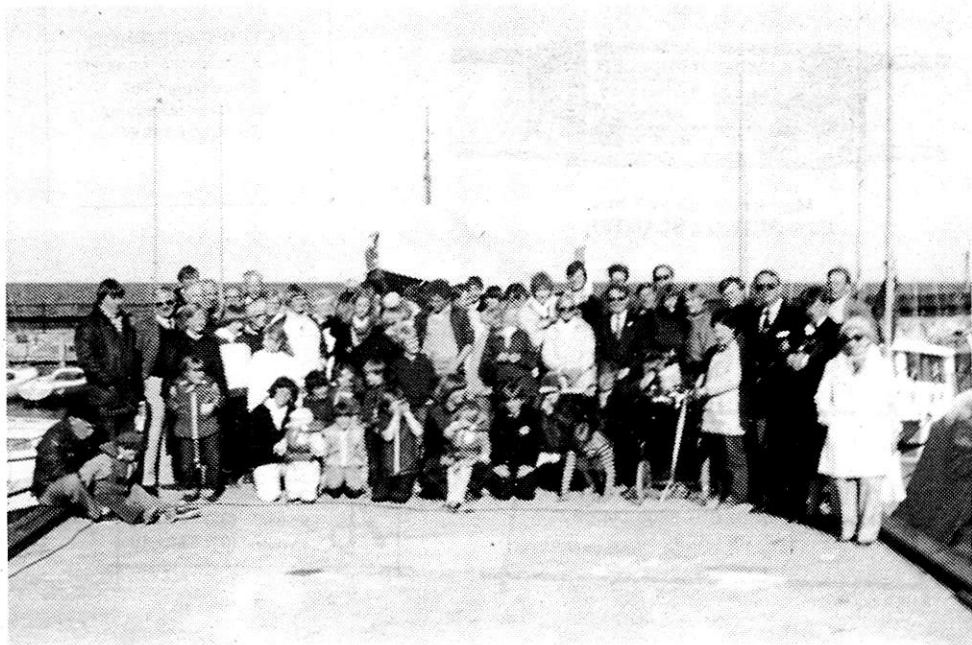
FRA STANDERHEJSNING I TAARBÆK SEJLKLUB MAJ 82.