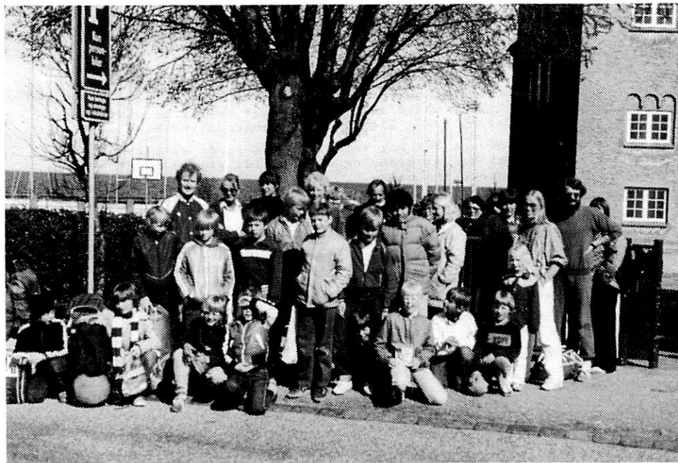
LILLEPUTTERNES AFGANG FRA TAARBÆK SKOLE TIL FODBOLDSSKOLEN I STRØNHULT.