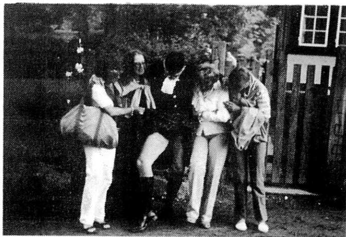
HVAD GEMMER EN SKOTTE UNDER SIN KILT???