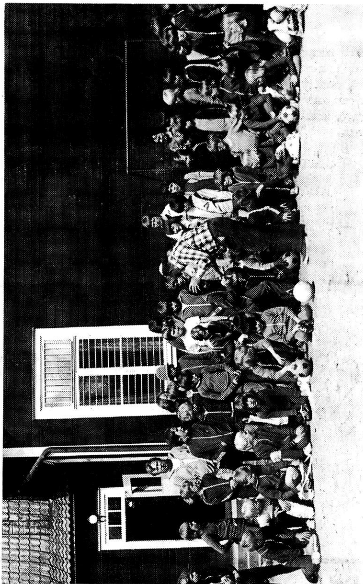
fra lilleputternes træningslejer i Lønsboda sammen med Kystalliancen det er HATTEMAGEREN der dirigerer sine tropper.