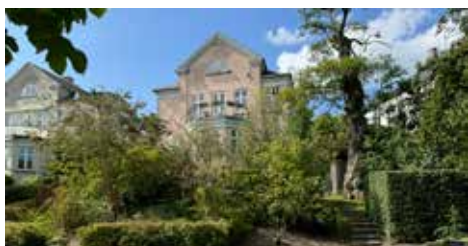
TAARBÆKDALSVEJ 4, 1. & 2.