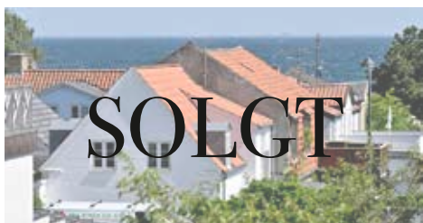
TAARBÆK STRANDVEJ 62