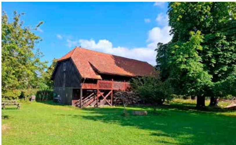
Taarbæk IF's klubhus