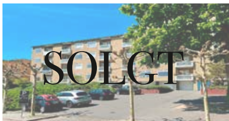
TAARBÆK STRANDVEJ 65A, ST. TV.