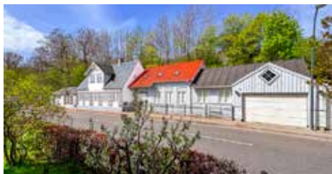
TAARBÆK STRANDVEJ 39