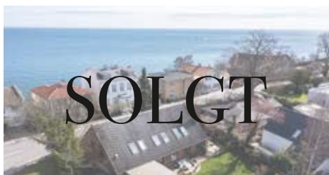
TAARBÆK STRANDVEJ 121