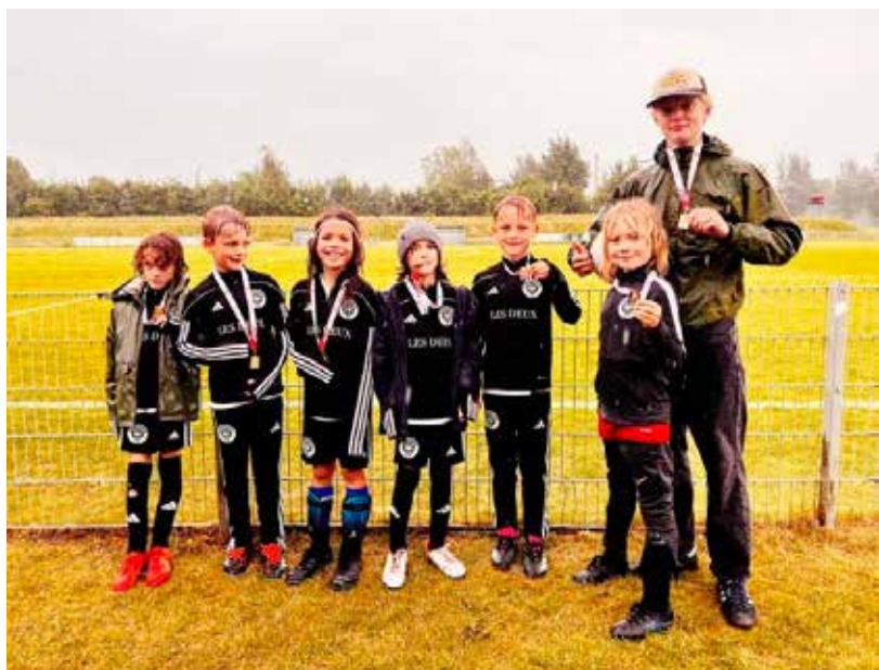
Taarbæk IF's U9 hold, som vandt medaljestævne juni 2024 (se mere om Taarbæk IF's ungdom side 35)