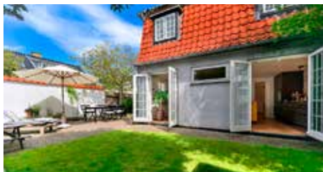
TAARBÆK PARCELVEJ 1, ST.