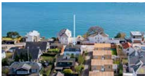
STRANDVEJEN 677, ST.