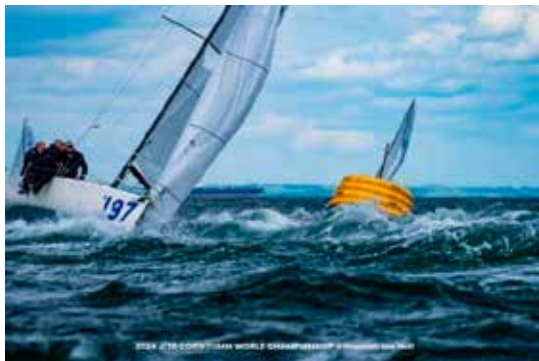
Kingston i en blæsende mærkerunding